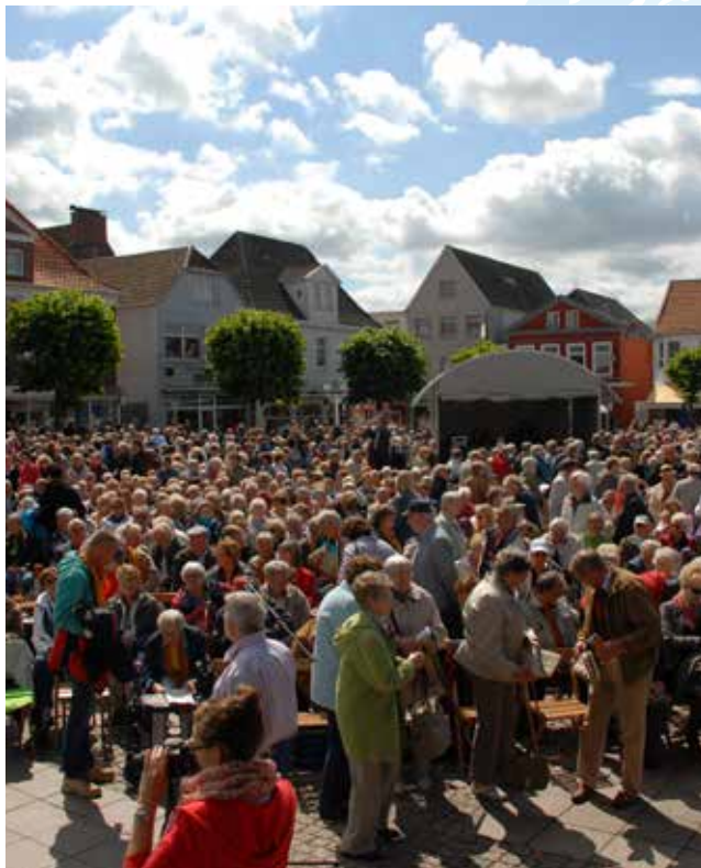
OKT 2012 in Aurich

Menschen auf der Suche nach Hoffnung: Hilfesuchende in den Beratungsstellen, Flüchtlinge, Menschen in Not. Ihren Fragen, Problemen und Wünschen gibt dieses Zentrum Raum.