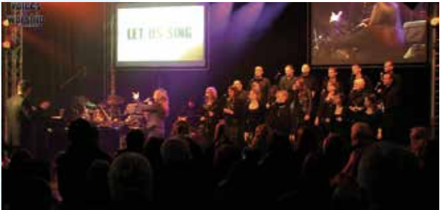
Voices of Worship