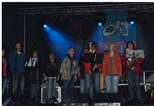
OKT 2012 in Aurich

Ort: Volksbankgelände Untenende 2 26817 Rhauderfehn