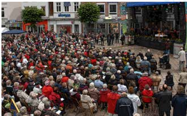
OKT 2012 in Aurich

Ort: Marktplatz Am Markt 26817 Rhaderfehn