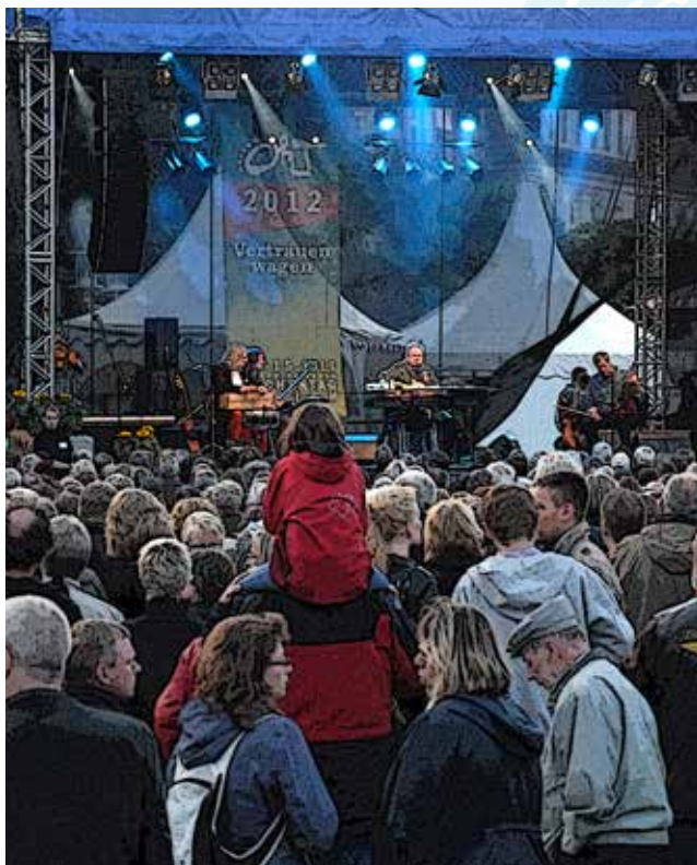
OKT 2012 Aurich

Ort: Marktplatz Am Markt 26817 Rhaderfehn